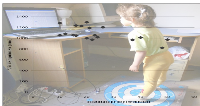
Fig. 2.IV. Titlul figurii

Fig. 1.IV.(patru roman indică nr. capitolului în care se găsește figura) Titlul figurii