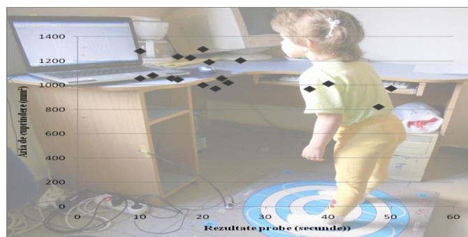
Fig. 2.IV. Titlul figurii